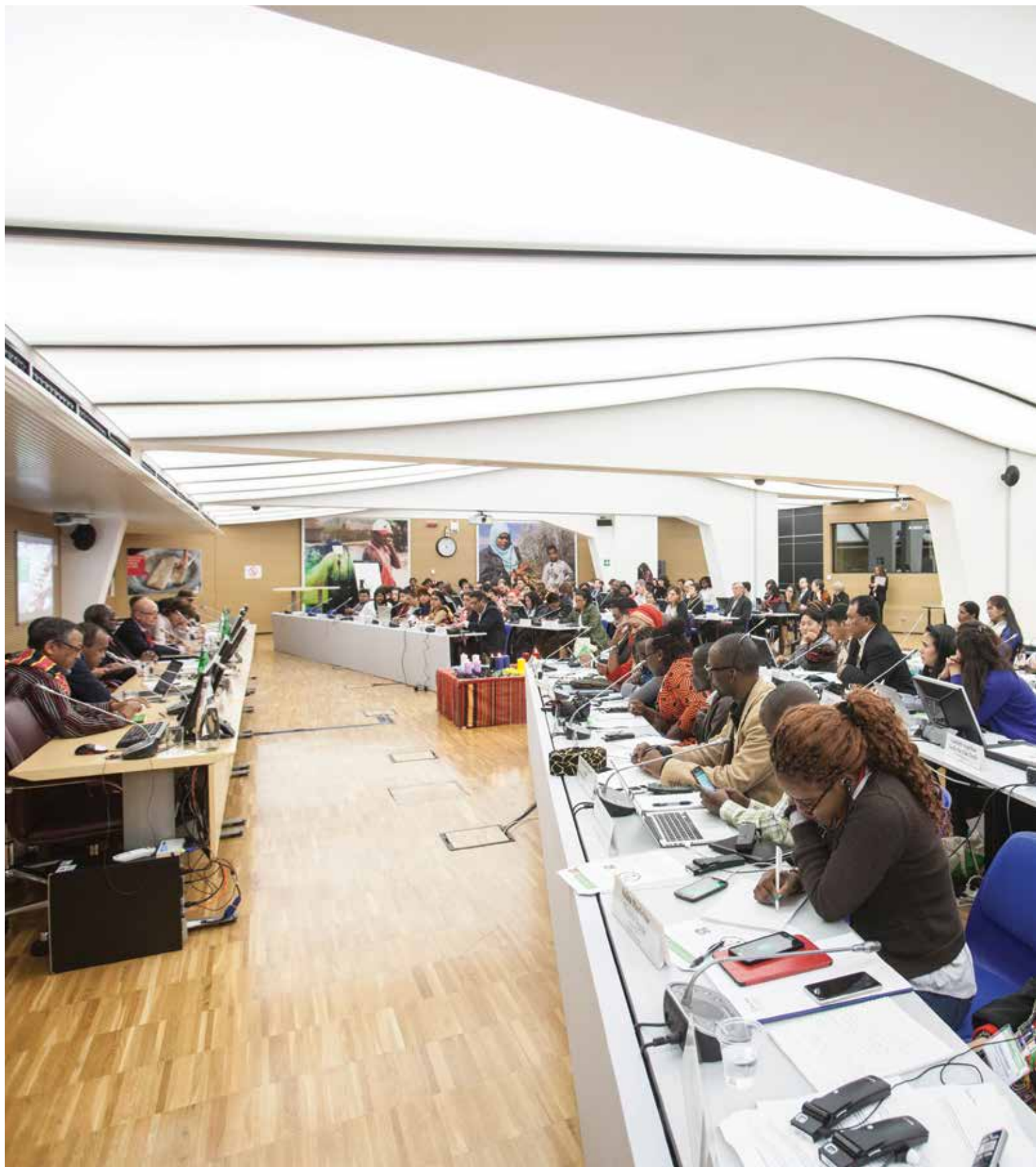
Sesión de apertura del Foro.