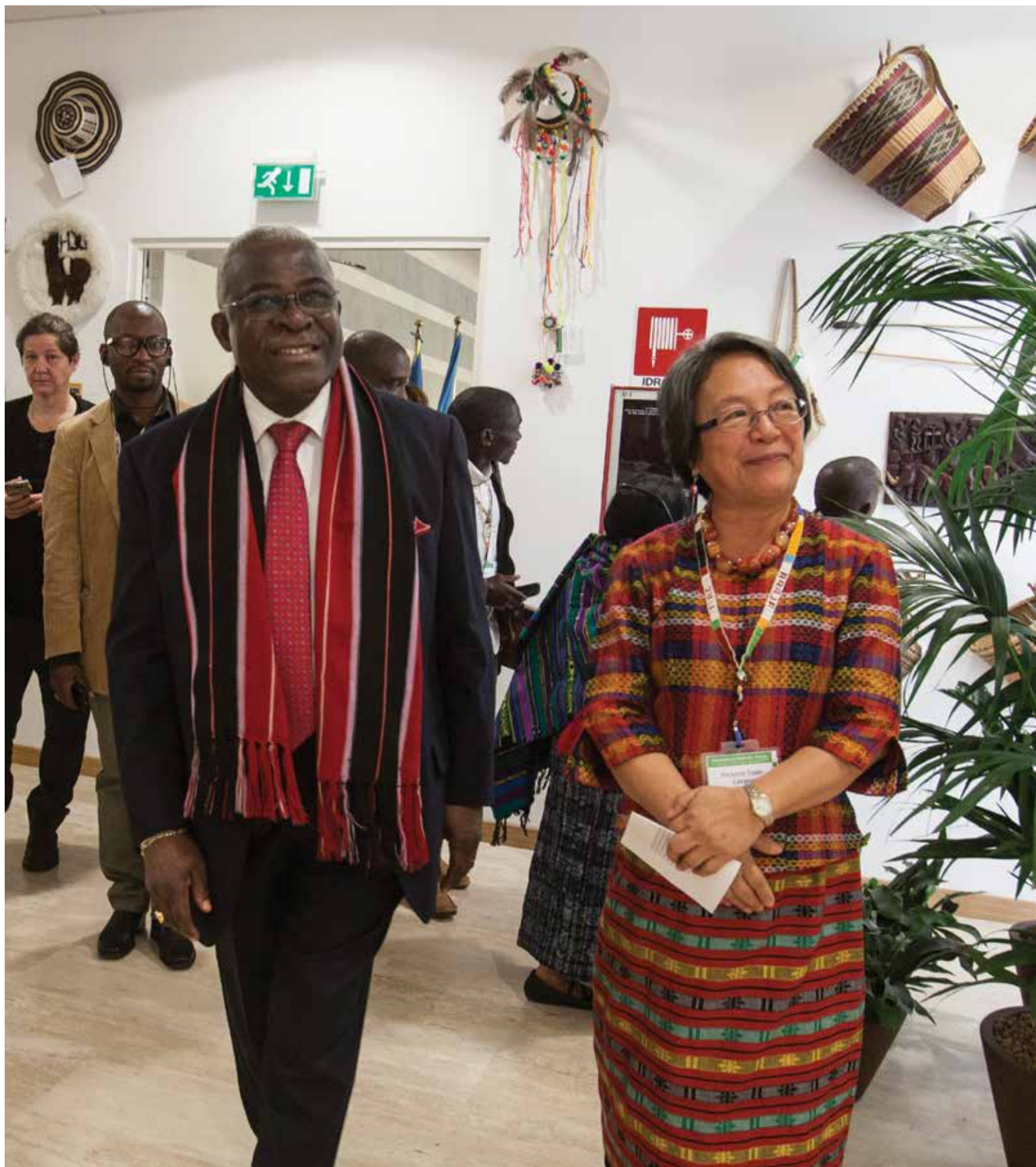
El Sr. Nwanze, Presidente del FIDA, y la Sra. Tauli-Corpuz, Relatora Especial de las Naciones Unidas sobre los derechos de los pueblos indígenas, en la inauguración del Espacio de los Pueblos Indígenas.