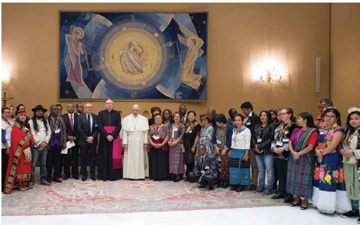
El Papa Francisco recibe a la delegación indígena en una audiencia privada.