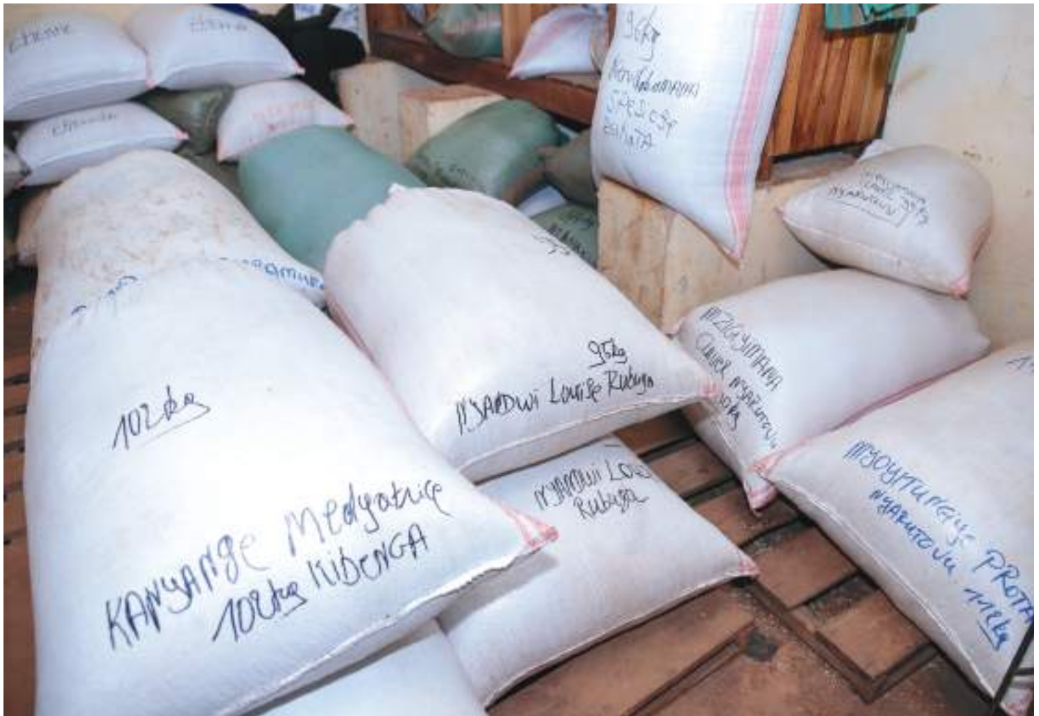
Le PAIVA-B a construit plusieurs hangars de stockage pour la conservation et la valorisation de la récolte.