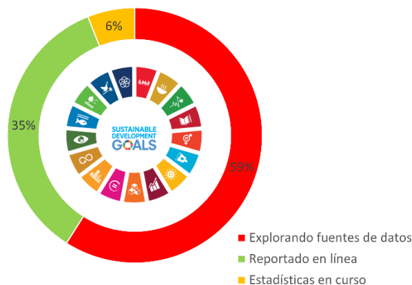
Figura 1. Situación de los informes sobre los ODS pertinentes en la agricultura

Se han identificado un total de 17 indicadores de los ODS, pero sólo el 35% de ellos tienen datos verificados y notificados en la plataforma en línea. Y para el 59% de ellos, el gobierno está explorando fuentes de datos para captar la información (véase la figura 1).