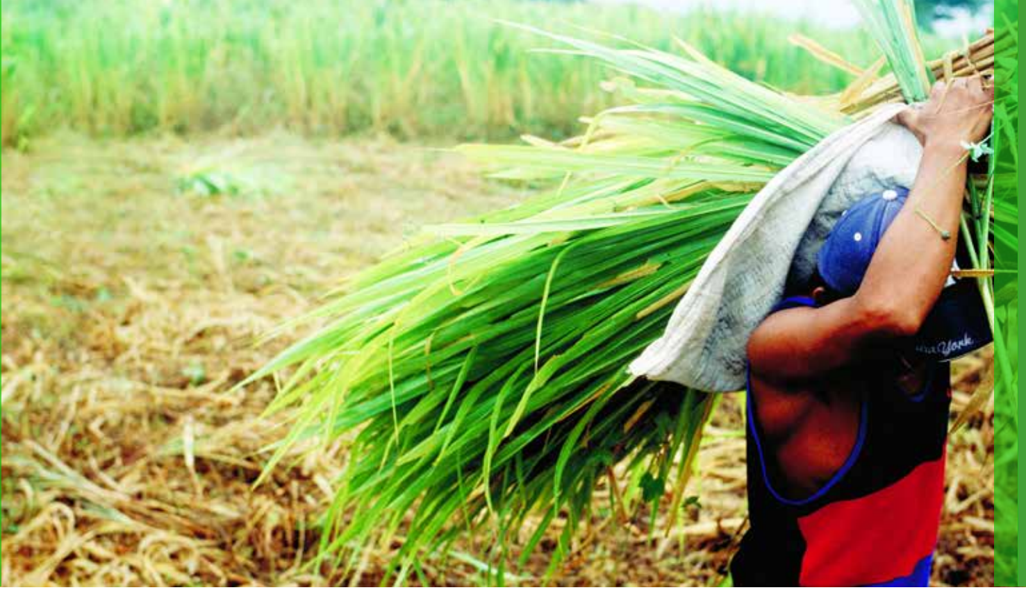
نيكاراغوا. رجل يجني قصب السكر في سانتو دومينغو دي غوزمان.