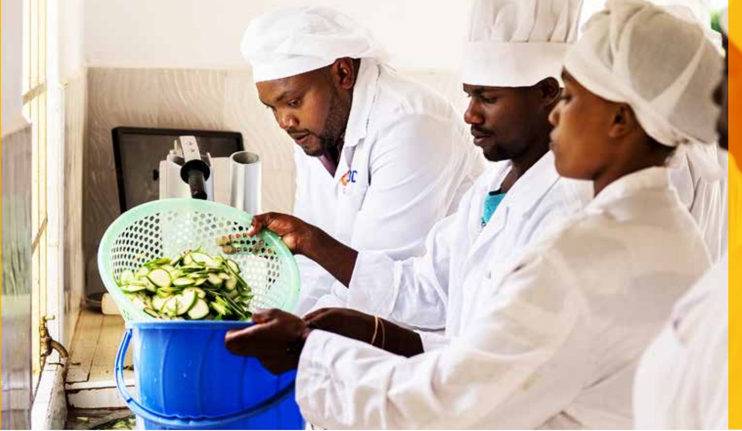
كينيا. الشباب من رواد الأعمال في مجموعة شباب G-Star يقومون بوزن الموز الطازج في محطة التجهيز الخاصة بهم.